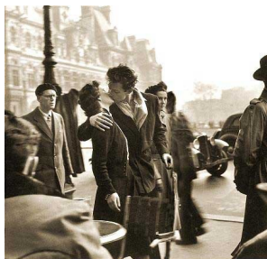
Hotel de Ville-ko musua