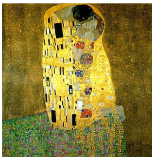
Gustav Klimt-en musua