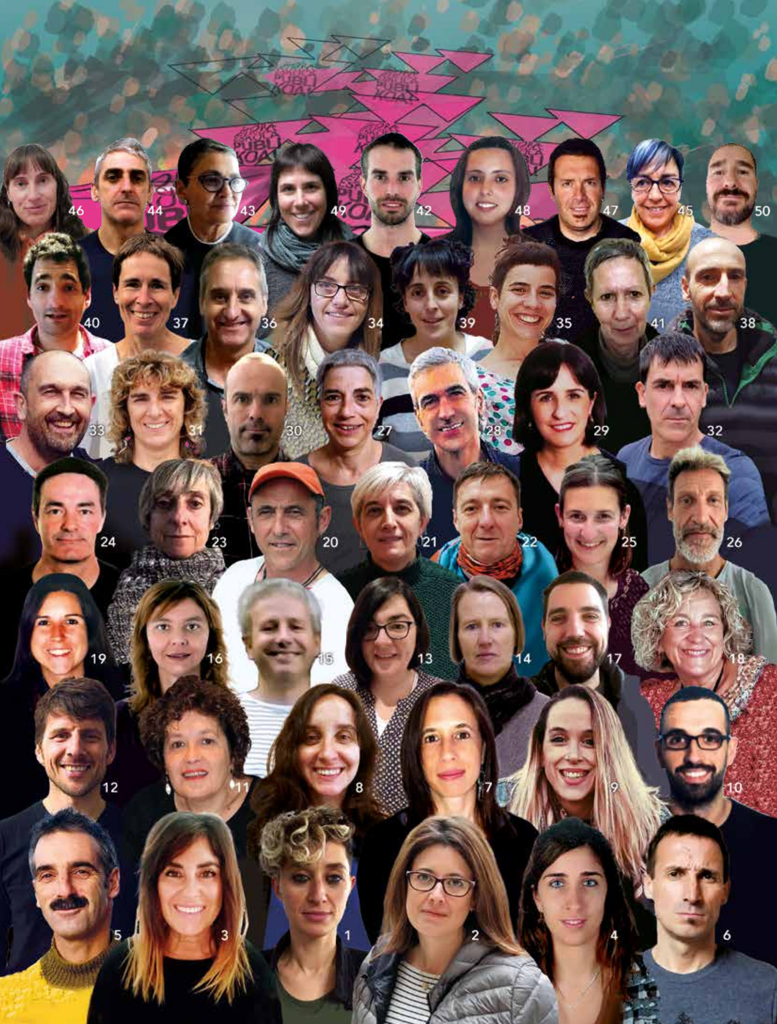
Irakasleak - Gipuzkoa