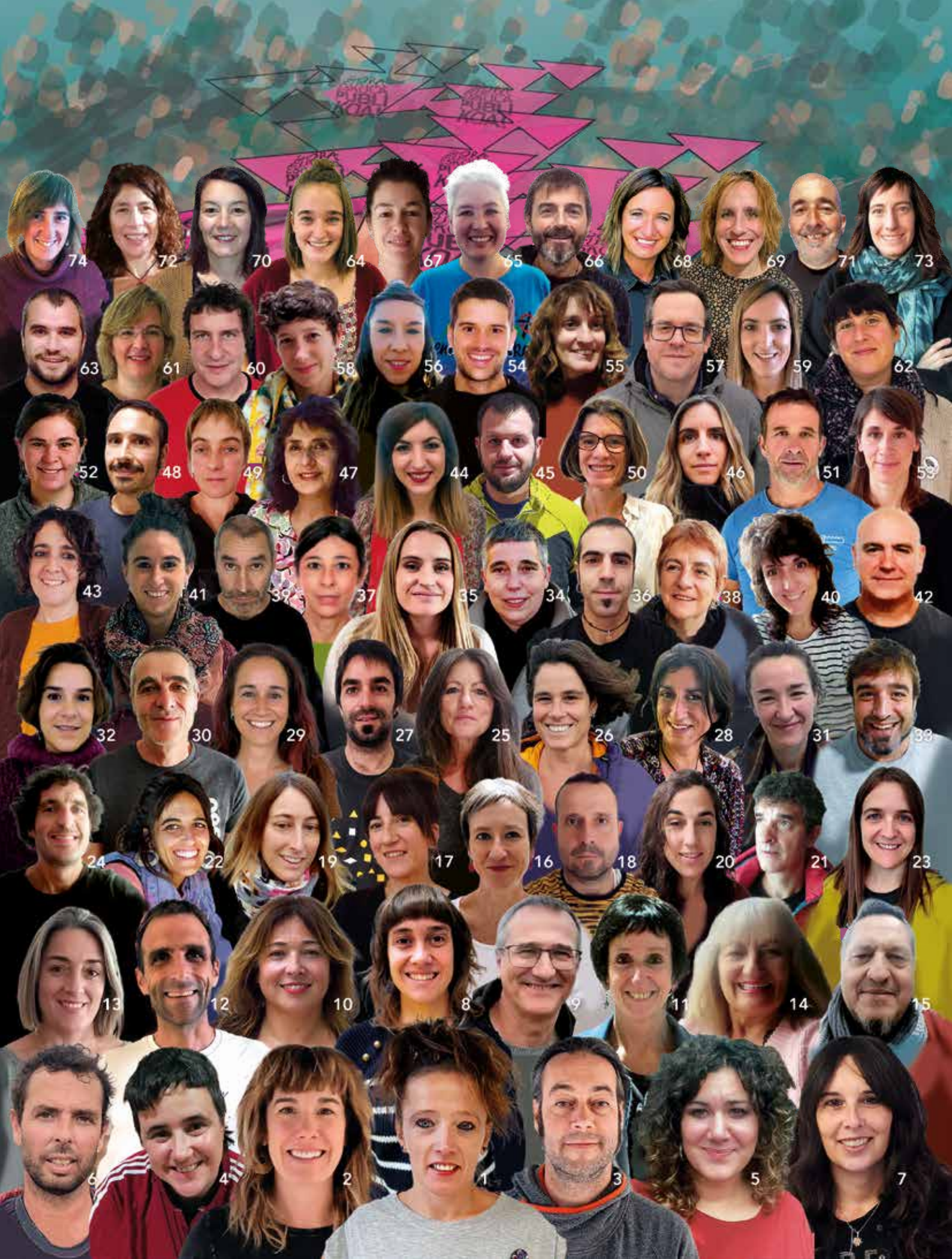
Irakasleak - Araba